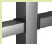
Raccordement aveugle – Fixation intermédiaire