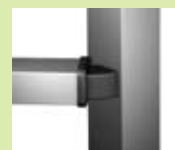
Angle différent à 90° construction charnière